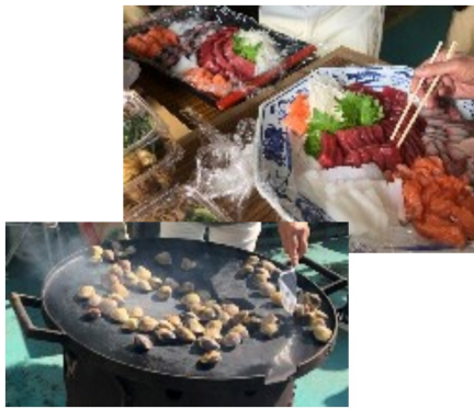
【お刺身・焼はまぐり】

会費としてお昼のランチ四、〇〇〇円は高い気もしますが、チャリティーとしてやっていることやお土産